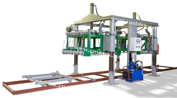
Резательный комплекс Монолит-24

Оборудование для производства пеноблоков